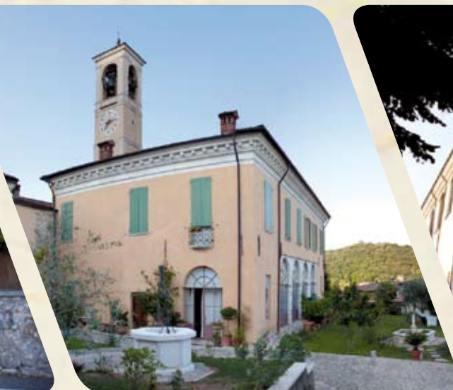
Canonica Mostra vini Produttori