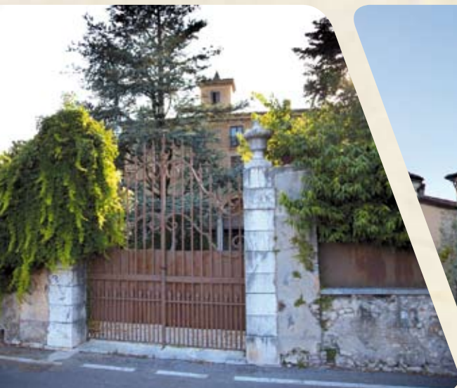
Villa Elide Mostra Bonsai