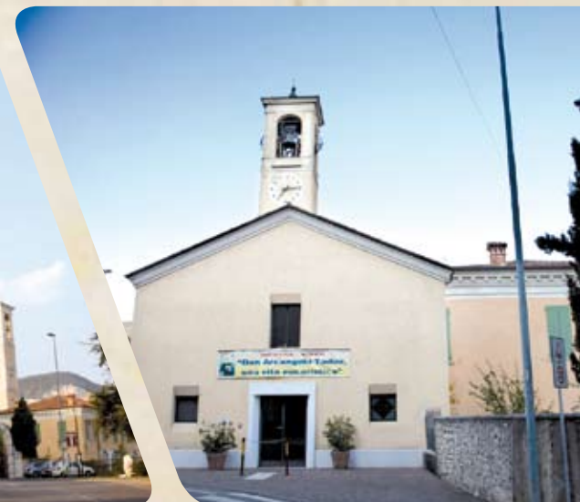
Sala Don Tadini Degustazione vini e formaggi Valsabbini